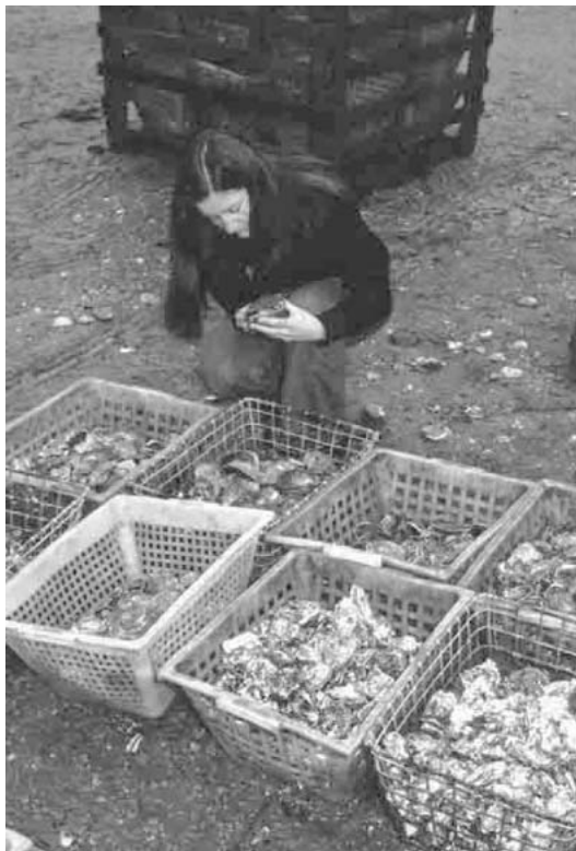
図4. 日本から移植されたマガキ, (手前の籠), (プルトーニュ)