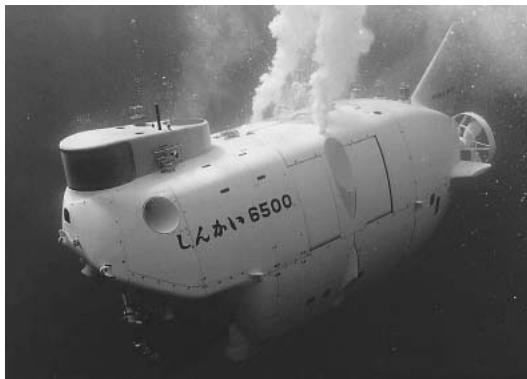
図2. しんかい2000 (左) と しんかい6500 (右)

本題の海洋学と水産学分野における日仏交流には長い歴史がある。この交流は1960年代にバチスカーフ（深海潜水艇の総称）が日本において最初の潜水を行った時代から始まった（図1）。その当時、東京水産大学学長に就任された故・佐々木忠義教授が潜水艇に乗船されたのを記念して日仏海洋学会が創立された。1970年代には、水産学分野も含めて活発な人的交流が行われたが、その後、海洋学と水産学の分野はそれぞれ独自に発展の方向を展開した。