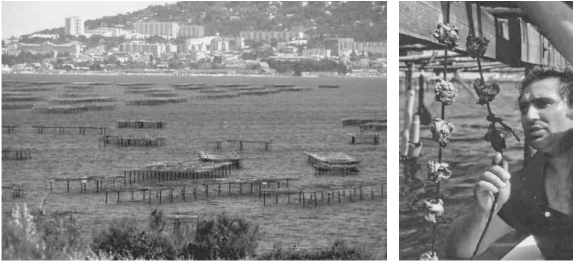
図6. トー湖 (Etang de Tau) における貝類垂下養殖 養殖施設全景 (左) と垂下されたフランスガキ (右)