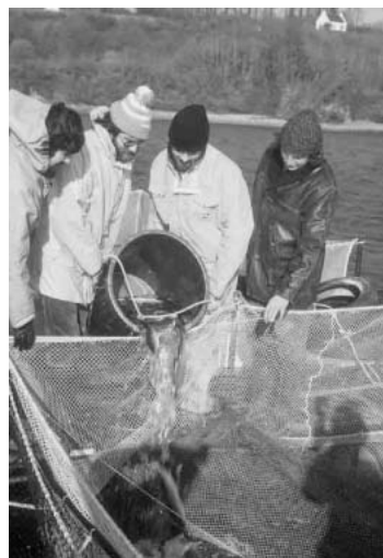
図5. 日本の技術導入例：アワビの種苗生産と放流（左），サケの網生養殖（右） (共にプルトーニュ)