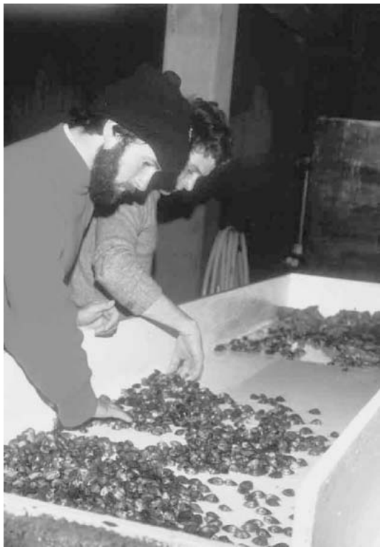
図3. 日本から移植されたアサリ (ノルマンディー)