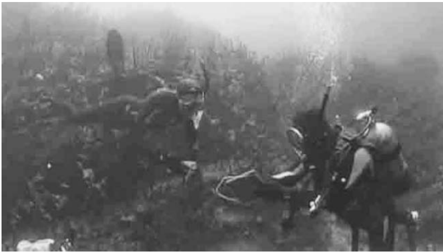
図7. イセエビ魚礁 (千葉県館山市) で研修を受けるフランスの若手研究者 (左)